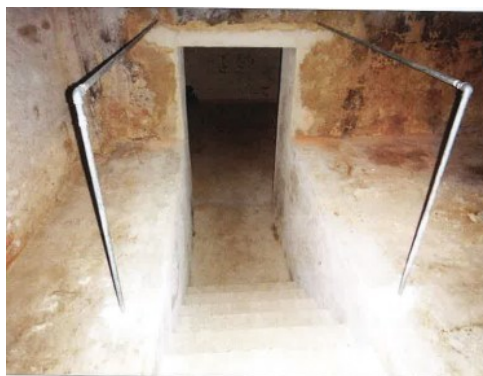
Widok fragmentu jednego z pomieszczeń.