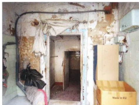
Widok fragmentu wiatrolapu i korytarza.