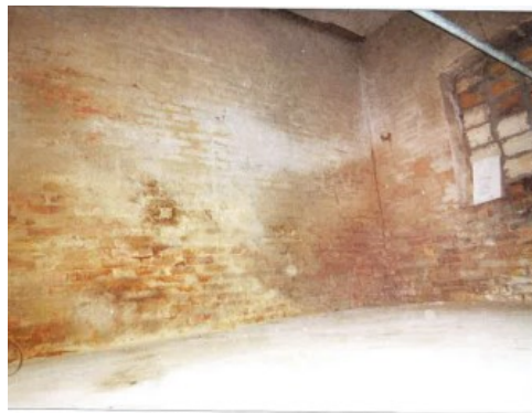
Widok fragmentu jednego z pomieszczeń.