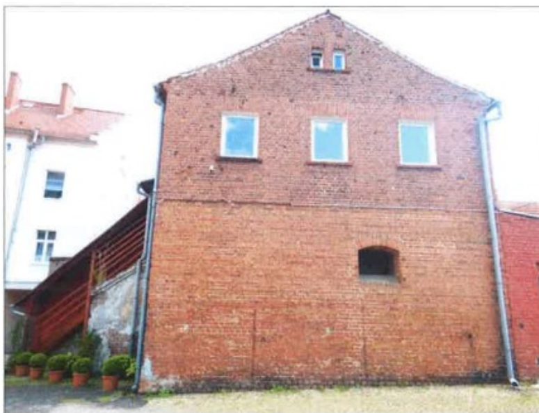
Ogólny widok budynku.

na sprzedaż lokalu przeznaczonego na cele inne niż mieszkalne Nr L1 znajdującego się w budynku położonym w Lubaniu przy ul. Łużyckiej 27B wraz z udziałem we współwłasności nieruchomości gruntowej (działka nr 3/5, AM 2, Obręb III o powierzchni 93 m 2 , JG1L/00032743/3)