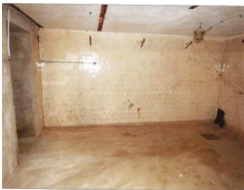
Widok fragmentu jednego z pomieszczeń.