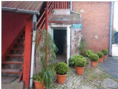
Widok elewacji frontowej budynku z wejściem do lokalu nr L1.