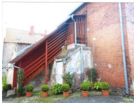
Widok części elewacji budynku z wejściem do lokalu.